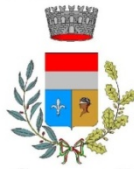
Comune di Odalengo Grande