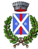
Comune di Solonghello