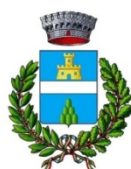
Comune di Coniolo