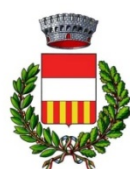
Comune di Camino