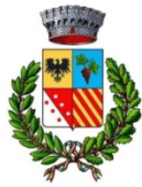
Comune di Moncestino