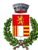
Comune di Gabiano